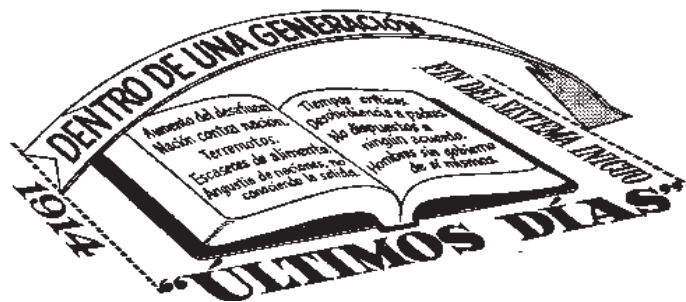
La Verdad Que Lleva a Vida Eterna , Pág. 95

4. (a) ¿Por qué podemos alegrarnos de que Dios no destruyera inmediatamente a los que no le estaban sirviendo cuando su reino entró en el poder en 1914? (b) ¿Cómo nos ayuda la Biblia, en 2 Pedro 3:9, a considerar este asunto apropiadamente?